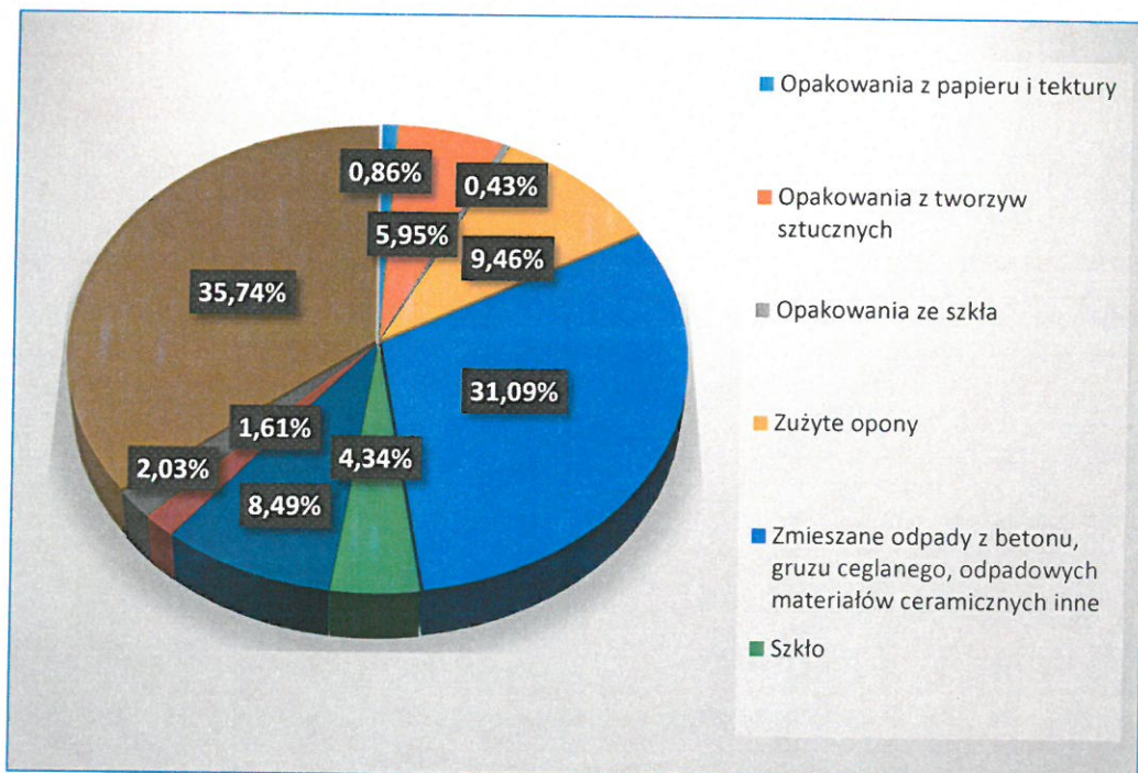
Wykres przedstawiający procentowy udział zebranych odpadów w PSZOK w 2022 r.